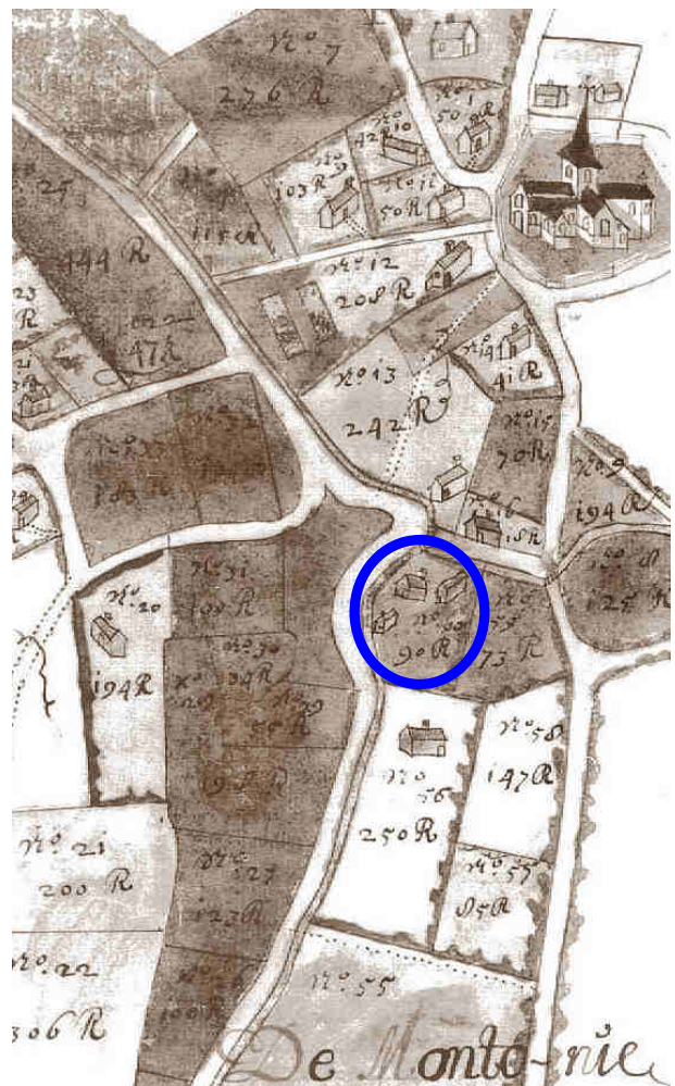
De Neercamme was gelegen op het perceel nr. 60 (kaart uit de atlas van het Brusselse Sint-Janshospitaal ca. 1712).

water werd geput (het zogenaamde putsel ), stelt vermoedelijk de eigenlijke brouwerij voor. Rond die tijd had het grondstuk een oppervlakte van 90 roeden of ongeveer 28,1 are.